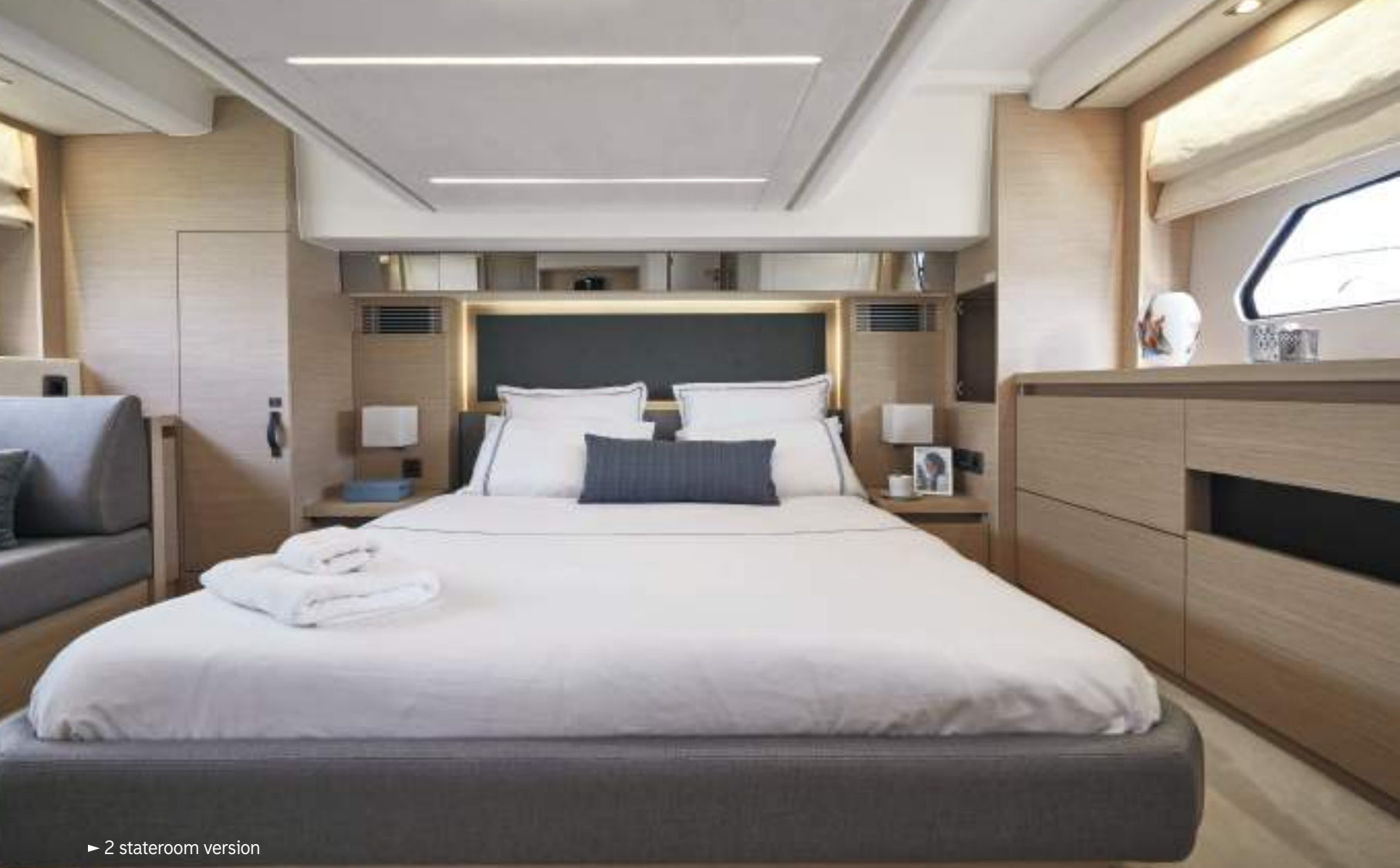
► 2 stateroom version