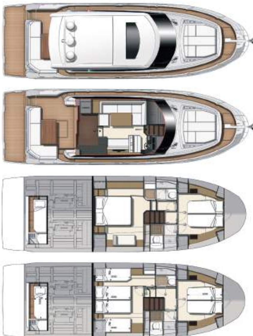
Model available with 2 or 3 staterooms

Connected boat technology. Equipped with sea@apps